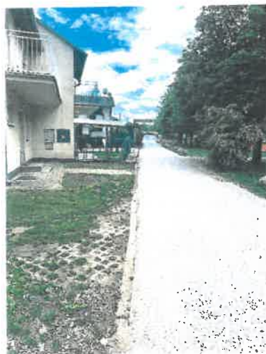
Príjazdová komunikácia parc. č. 2552/1