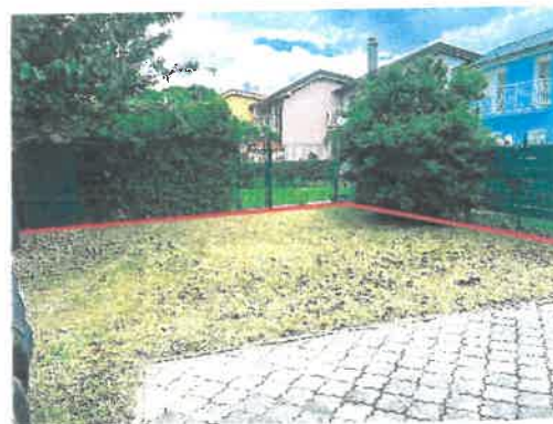
Záhradka - novovzniknutá parc. č. 2587/75